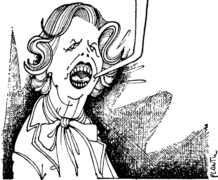
(Dessin de PLANTU.)