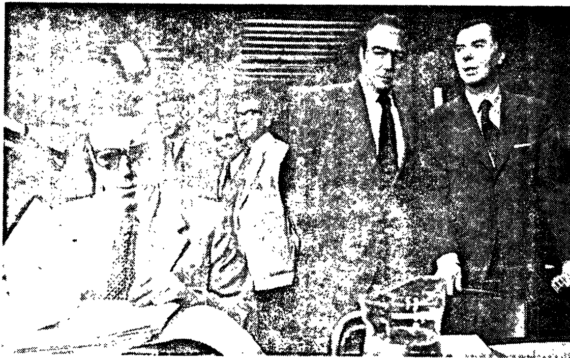
MM. Van Elsannde, Ortoli et Tindemans avant l'ouverture des travaux.

Mais le plat de résistance, si l'on ose dire, fut constitué par une série de longs exposés dont les conclusions au moins étaient désespérément semblables : contrairement aux pronostics d'un certain nombre de « compétences », la fin de la crise économique n'est nullement en vue. Ce tour de table à la fois brillant et lugubre fut si long qu'il était plus de 21 heures lorsque M. Tindemans put en tirer les conclusions pour la presse. Il ne manqua pas de rendre un hommage de connaisseur aux exposés de ses collègues dont nous reproduisons l'essentiel par ailleurs. Il répéta qu'il était profondément convaincu qu'une relance économique en profondeur ne pouvait être envisagée avant