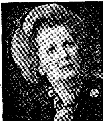
Von Kanzler Schmidt wegen guter Gipfelführung gelobt: Großbritanniens Premier Thatcher.

Noch immer entscheidet sich der politische Erfolg eines Ministers nicht in Brüssel, sondern in den Hauptstädten. Das EG-Parlament ist bei weitem zu schwach, um hier für einen Ausgleich sorgen zu können. Europa bietet zudem oft einen willkommenen Anlaß, innenpolitischen Auseinandersetzungen aus dem Weg zu gehen. Niemals zum Beispiel hat im Bonner Kabinett eine wirkliche Diskussion über Prioritäten und Stellenwert der Agrarpolitik stattgefunden. Probleme der Regierungskoalition wurden so von vornherein auf Brüssel abgeladen.