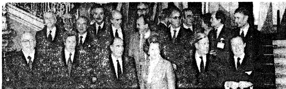
La foto di congedo dei Dieci: in primo piano da sinistra Spadolini, Fitzgerald, Mitterrand, la Thatcher, Schmidt, Thorn. In secondo piano Papandreu, ministri degli Esteri ed esperti

La risorsa di scavalcare i dissensi interni rifugiandosi nei temi politici — rapporti Est-Ovest, conferenza madrilena per la cooperazione e la sicurezza, conferenza di Ginevra sugli euromissili, Polonia, Afghanistan, Medio Oriente, di cui si dà conto in un comunicato conclusivo — è stata in gran parte vani-