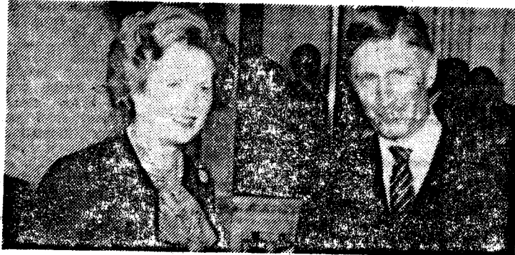
Premier van Agt met Margaret Thatcher.