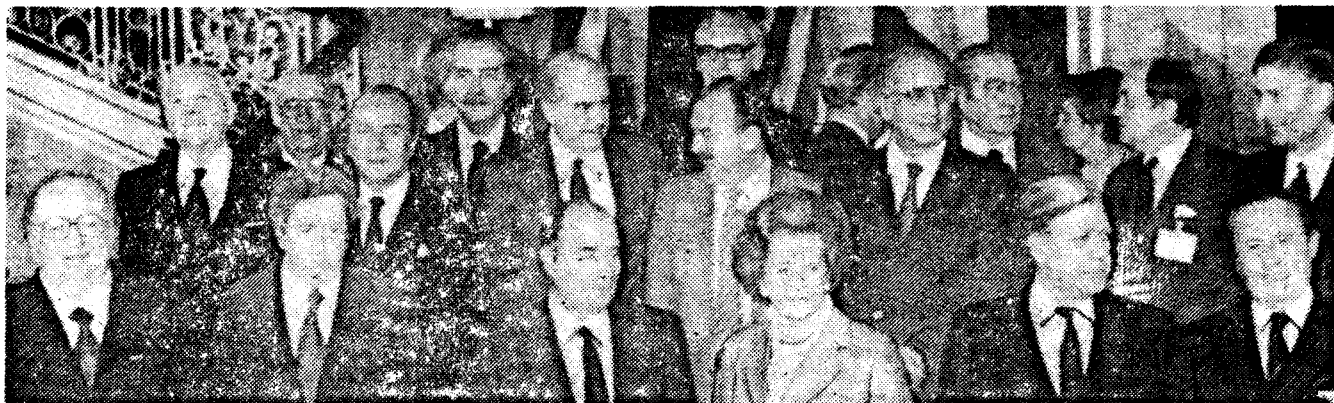
Le portrait d'une famille européenne quelque peu désunie. De gauche à droite, au pied des marches de Lancaster House, MM. Spadolini (Italie), FitzGerald (Irlande) et Mitterrand, Mme Thatcher (Grande-Bretagne), MM. Schmidt (R.F.A.) et Thorn (président de la Commission européenne).

Fidèles à leurs mauvaises habitudes, les chefs d'Etat ou de gouvernement des Dix ont terminé avec plusieurs heures de retard les travaux du Conseil européen. Bien qu'ils aient prolongé leurs discussions jusqu'à près de 19 heures (heure française), ils n'ont guère pu que masquer plus ou moins habilement l'échec de cette conférence de Londres sur une série de points clés. Il appartient désormais aux ministres