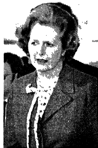
MARGARET THATCHER ...onverzoenlijk...

Ten slotte hebben de Negen hun ongerustheid uitgesproken over de trage vooruitgang van de onderhandelingen tussen Israël en Egypte over de Palestijnse autonomie.