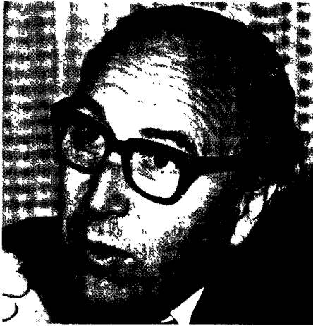
EC Commission President Roy Jenkins.

EC Commission President Roy Jenkins is reviving earlier unsuccessful plans for the creation of a single European currency and a central monetary authority.