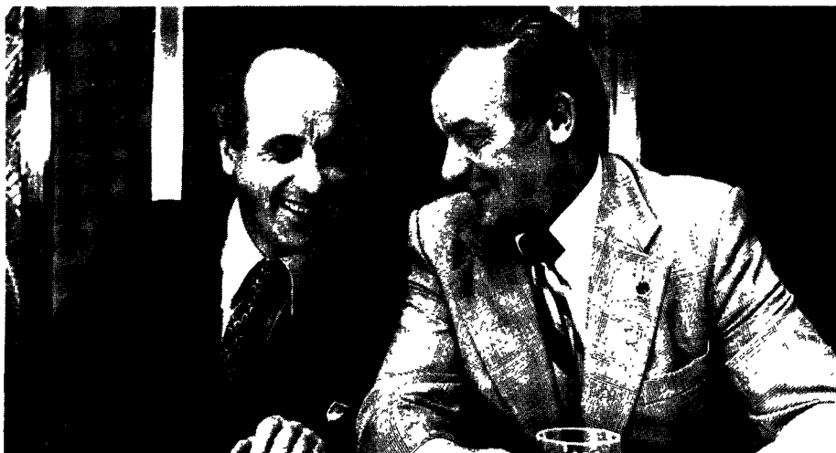
Le ministre canadien de l'Industrie et du Commerce M. Jack Horner rencontre à Bruxelles le commissaire de la C.E. responsable des Affaires industrielles, le Vicomte Etienne Davignon.

Les entreprises canadiennes sont définitivement intéressées à accroître leurs relations d'affaires avec la C.E., comme en a témoigné la visite de M. Jack Horner, ministre de l'Industrie et du Commerce, et de quelque 150 cadres supérieurs au siège de la C.E. à Bruxelles fin novembre.