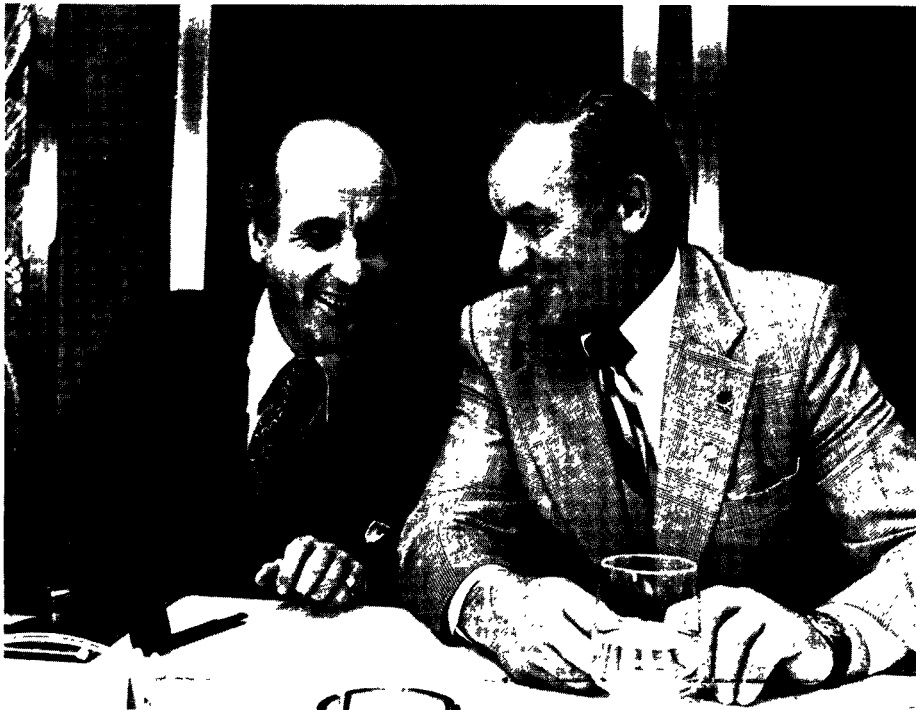
Canadian Minister of Industry, Trade and Commerce Jack Horner meets in Brussels EC Commissioner for Industrial Affairs, Viscount Etienne Davignon.

Canadian firms are keenly interested in more business with the EC. That was the message Jack Horner, Minister of Industry, Trade and Commerce, and some 150 top Canadian executives took to EC headquarters in Brussels at the end of November.