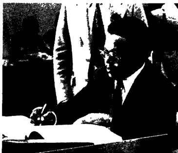
Bernard St. John, Deputy Prime Minister of Barbados and President of the ACP Council