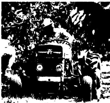
A Massey-Ferguson tractor, the big firms take care of themselves, but smaller Canadian firms could turn to the Marriage Bureau to find business partners in Europe