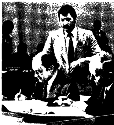
At left, Development Commissioner Claude Cheysson, at right, Michael O'Kennedy, Irish Foreign Minister and President of the EC Council of Ministers

Mais ces firmes ont un important allié à Bruxelles: le Bureau de rapprochement des entreprises, plus connu sous le nom de "Bureau des mariages", qui a été instauré en 1973 par la Commission européenne. Son but: aider les petites et moyennes entreprises de pays tiers à trouver des partenaires dans la Communauté européenne afin de développer des entreprises. De cette façon, le Bureau aide chacun des partenaires à accorder leurs besoins et leurs connaissances techniques.