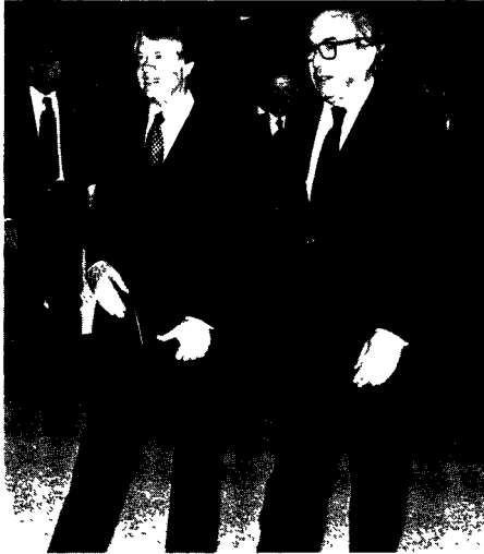
Le président Jimmy Carter avec le président de la Commission de la C.E. M. Roy Jenkins.

Le président des Etats-Unis, M. Jimmy Carter, a visité le 6 janvier le siège social de la Commission de la C.E. à Bruxelles; il devient ainsi le premier président américain à se rendre officiellement au siège administratif de la C.E.