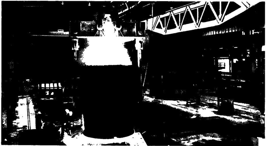
Une fonderie d'acier à Sheffield en Grande-Bretagne.