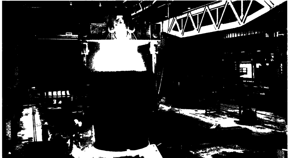
Steel foundry in Sheffield, Britain.

To cope with a growing loss of jobs and surplus capacity in the EC steel industry, the Nine have agreed to: