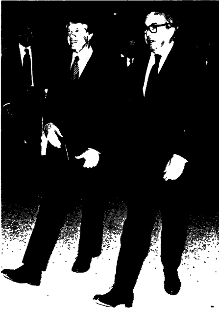
President Jimmy Carter with EC Commission President Roy Jenkins.

U.S. President Jimmy Carter on 6 January became the first U.S. president to visit the EC Commission headquarters in Brussels.